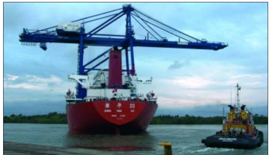
La grúa a su llegada al puerto colombiano

La terminal de Grup TCB de Buenaventura recibe una tercera grúa pórtico