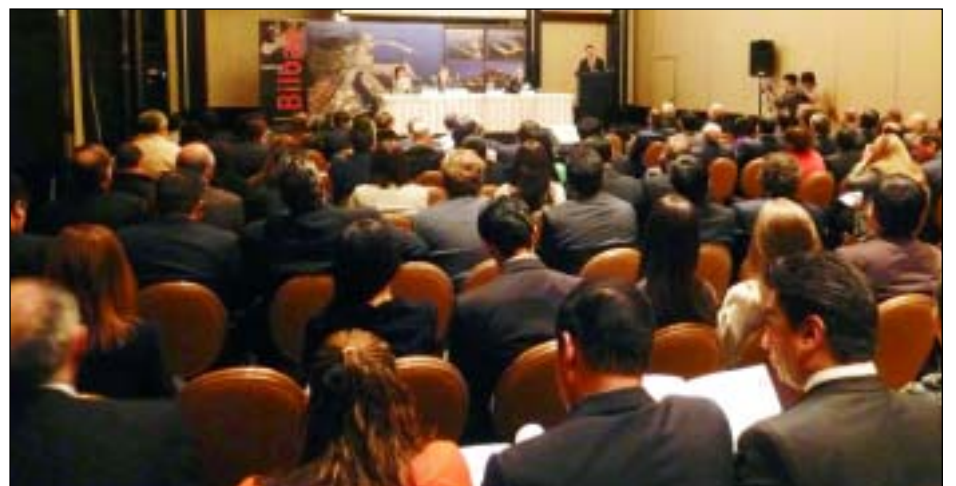
Las presentaciones de Uniport Bilbao en México DF y Veracruz obtuvieron una importante audiencia

China Shipping adquiere el 24% de la terminal de APM en el puerto de Zeebrugge