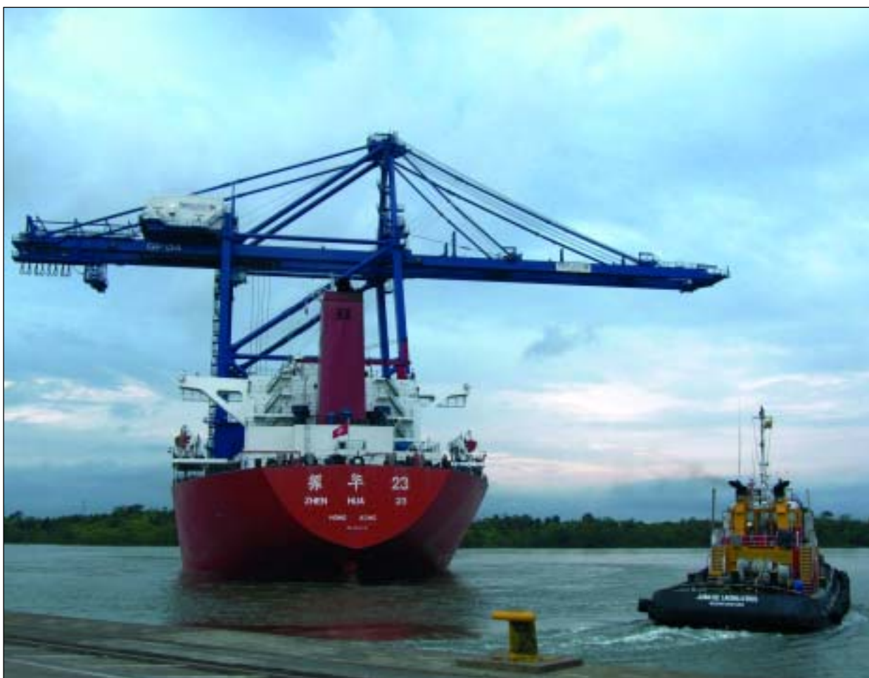
La nueva grúa tiene una capacidad para 65 toneladas

La grúa fue construida por la empresa china ZPMC y llegó a Buenaventura a bordo de la embarcación «Zhen Hua 23».